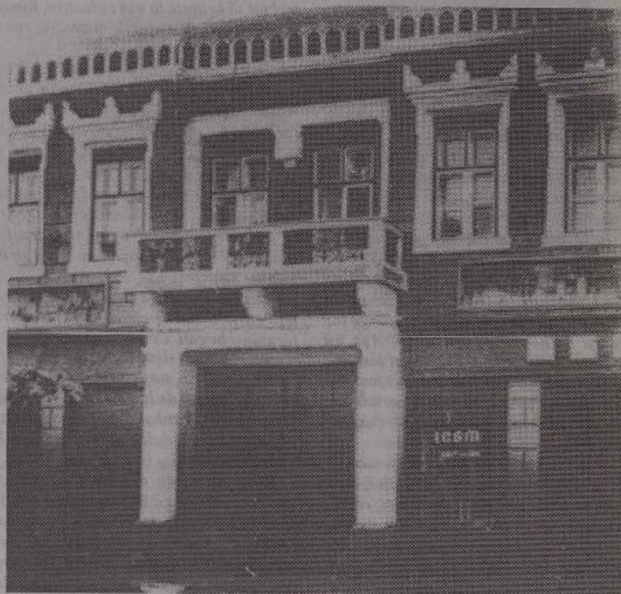
Casa lui F. Binder din Sebeș

Muzeul din Sebeș Alba adăpostește de asemeni: arme (măciuci, arcuți și săgeți), tolbe din piele și scuturi, precum și obiecte de îmbrăcăminte, podoabe de uz casnic și de cult.