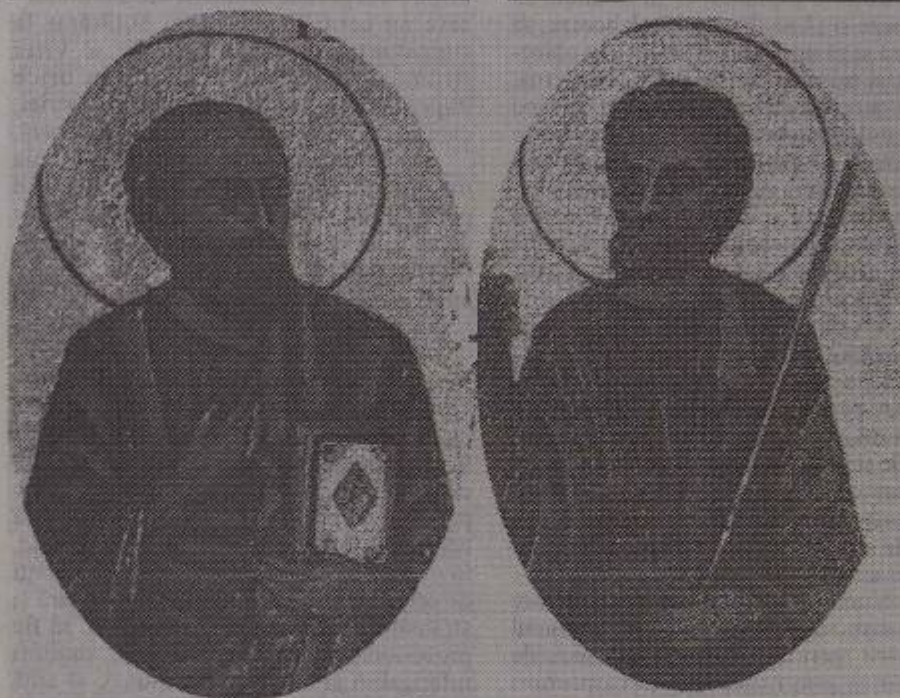
29 iunie - Praznicul Sfinților Apostoli Petru și Pavel

Voi sunteți lumina lumii.” (Matei 5, 13-14)