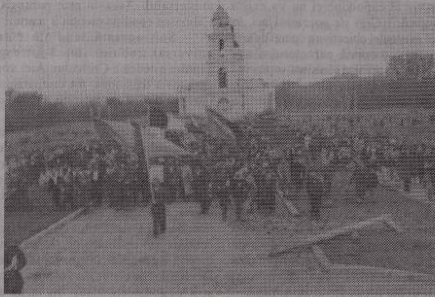
Românii din Chişinău manifestând în 1941 pentru revenirea Basarabiei la patria mamă

Pe drum ne dădea numai apă, iar ca hrană mâncam ce luasem de acasă. Drumul cu trenul până în Ural a fost de trei săptămâni, apoi am fost coborâţi din