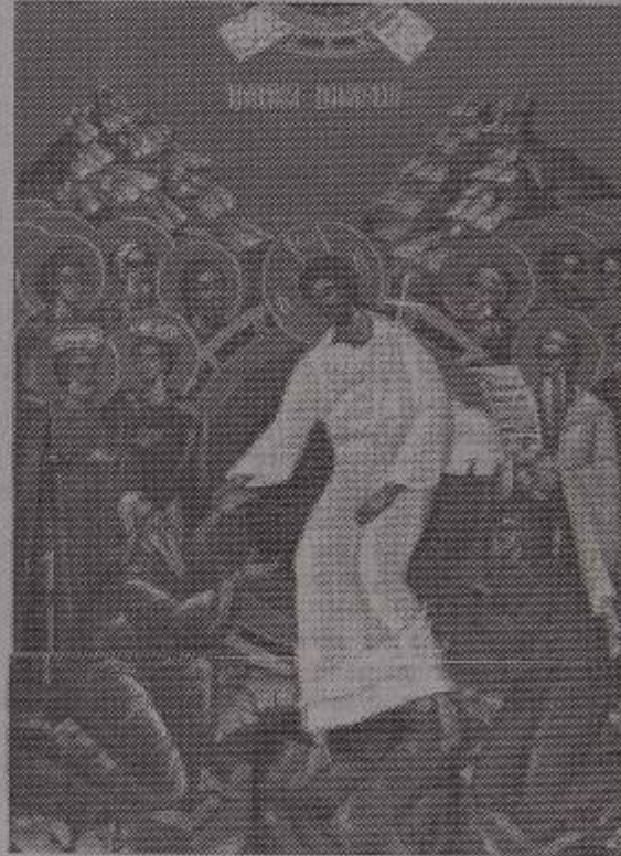
Reproducere după o icoană de Grigore Ion Popescu

noi numai pentru viața aceasta ne punem nădejdea în Christos, atunci suntem cei mai nefericiți dintre toți oamenii". Credința în Christos e credința în învierea Lui; iar credința în învierea Lui e credința în învierea morților, în propria noastră înviere. Dacă în învierea Lui credem, dar nu credem în învierea noastră, suntem cei mai nefericiți dintre oameni, zice Pavel. De ce oare? Fiindcă nefericirea omului este moartea. Precum, ca să ajungem la trunchiul unui copac, înaintăm prin umbra lui, tot astfel înaintăm în umbra morții până la clipa din urmă. Gustul amar al nefericirii noastre îl dă