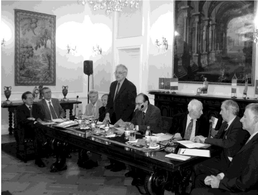
Acad. Florin Constantiniu, rostind cuvântul de deschidere a conferinței