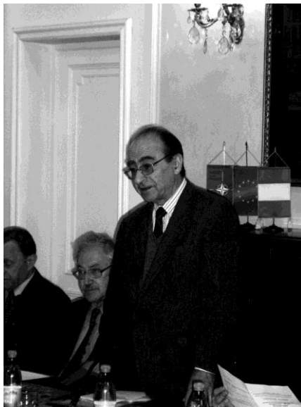
Acad. Gheorghe Vlăduțescu rostind cuvântul de deschidere a conferinței